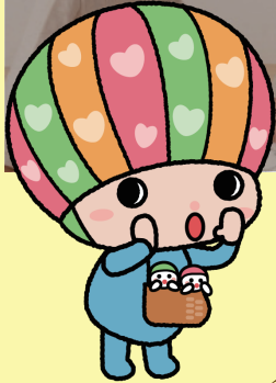
佐賀県子育て応援キャラクター さがっぴい

子どもにとっての地域の居場所。それは、自分のいる場所を指すこともあれば、得意分野を指すこともある。自分に関わり、自分を見て、自分に声をかけて、自分の話を聞いてくれる時間。それを通じて、子どもたちの中に「何か」が溜まっていく。学校でもなく、家庭でもない。「ナナメのつながりづくり」。子どもの将来を地域で一体となり育みたい。そんな気持ちが集う場所です。